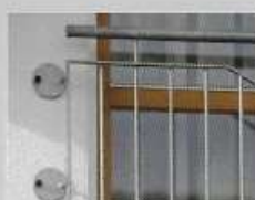
Ballustraldek / Balkonhekken